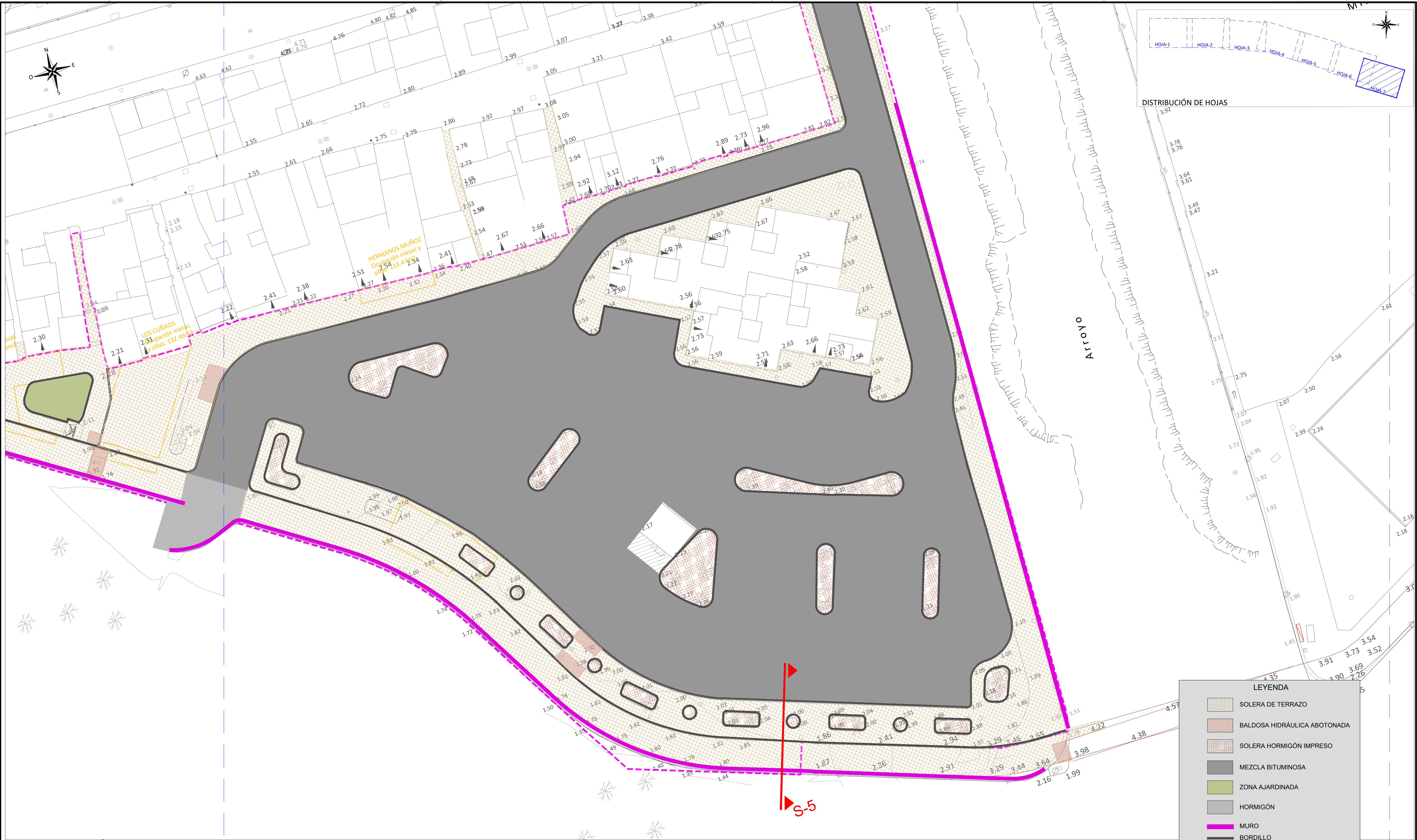
DISTRIBUCIÓN DE HOJAS